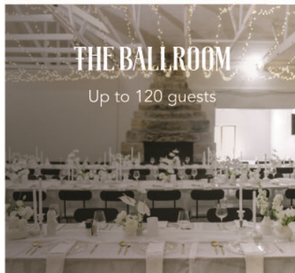
THE BALLROOM Up to 120 guests

We offer an authentic country experience with an emphasis on beauty and simplicity, from our architectural design to the food we serve. Our mission is to delight each guest with thoughtful touches and pleasant surprises throughout their stay. Experience a weekend of joyous celebration surrounded by the warmth of family and friends!