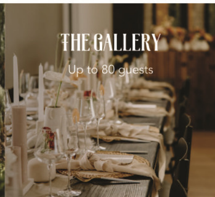
THE GALLERY Up to 80 guests

On-site, we can accommodate 34 guests, while the town of Rosendal offers over 30 guesthouses, all within walking distance of The Rosendal Country Retreat, ready to welcome the rest of your party.